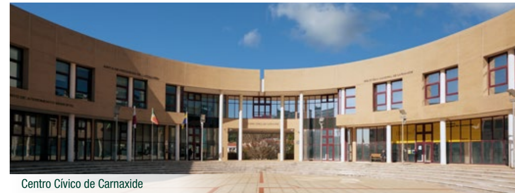
Centro Cívico de Carnaxide