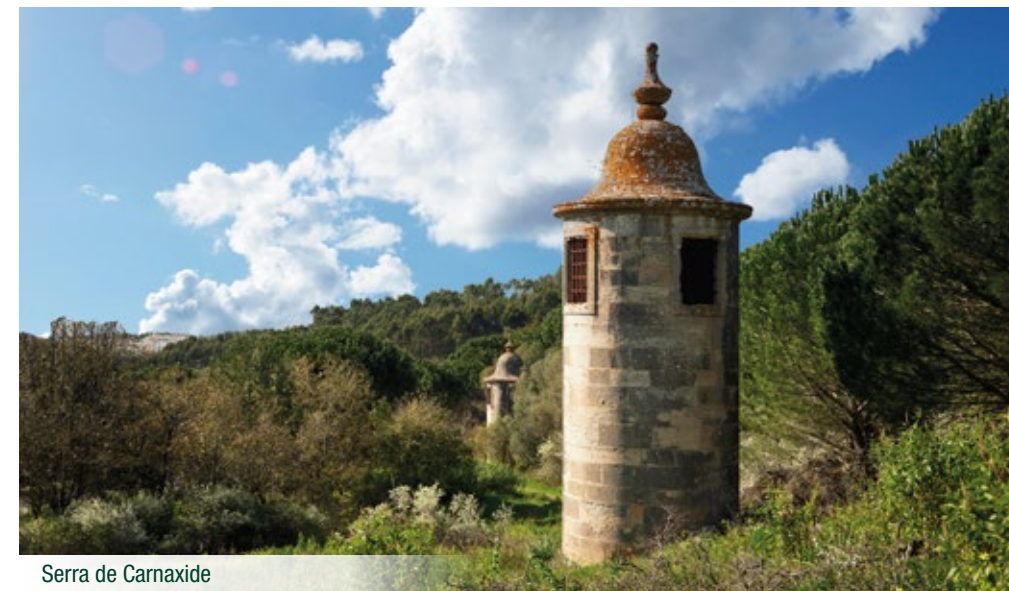
Serra de Carnaxide