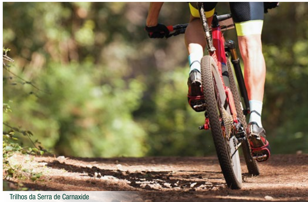
Trilhos da Serra de Carnaxide

Nature and History - One of Portugal's oldest documented towns, Carnaxide remains as if in a true time capsule. Here, we find architectural landmarks that are important biologically, socially, and religiously. The beginning of a story and a future in the making.