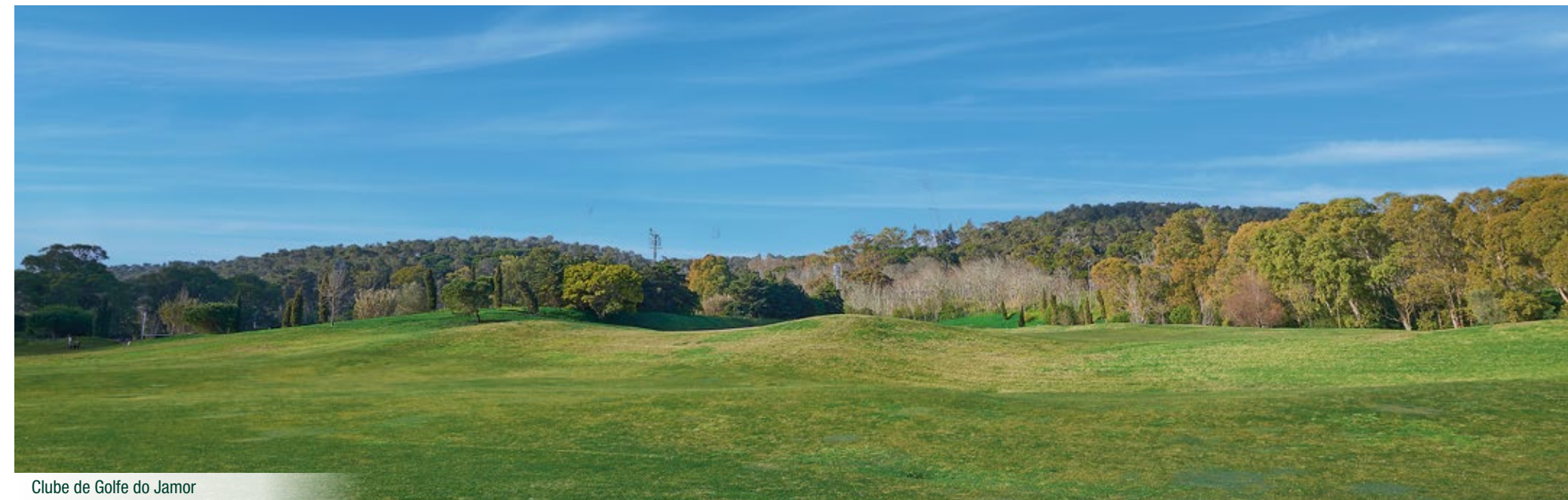
Clube de Golfe do Jamor