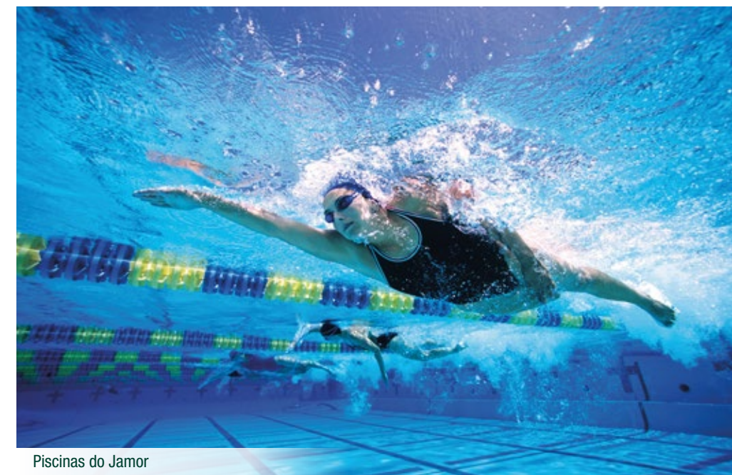
Piscinas do Jamor