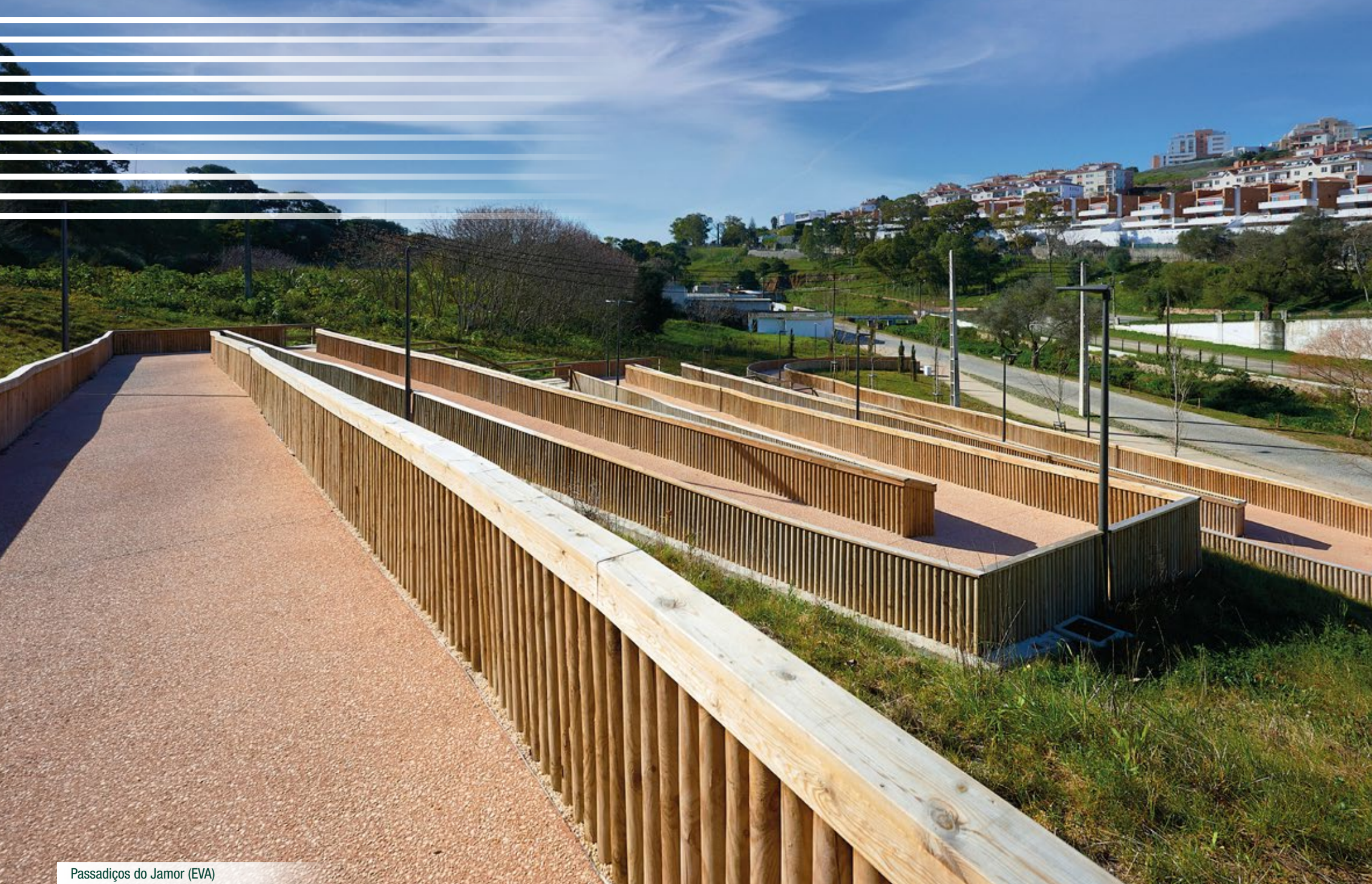
Passadiços do Jamor (EVA)