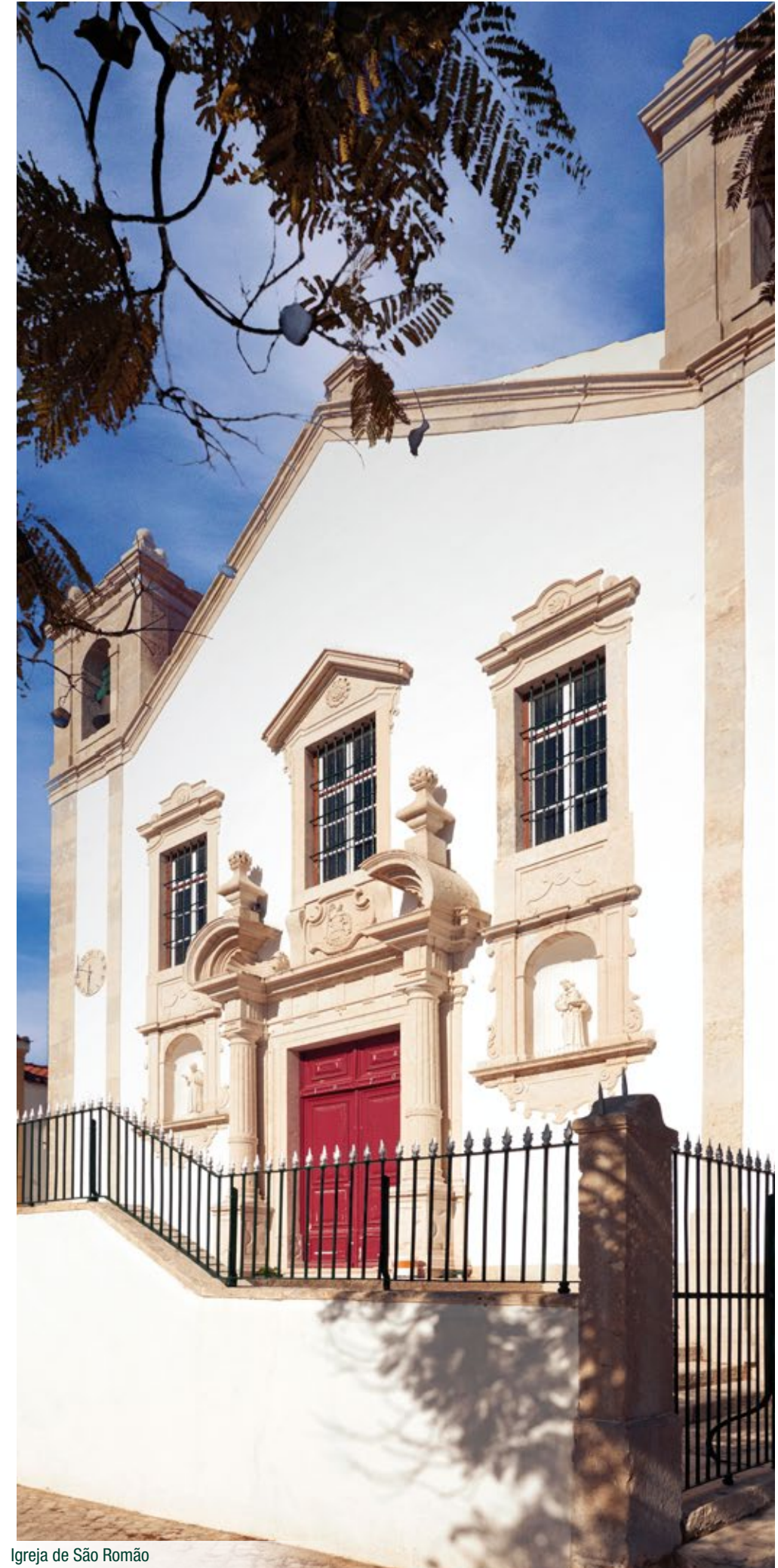
Igreja de São Romão