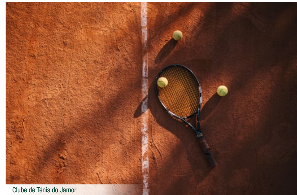
Clube de Ténis do Jamor