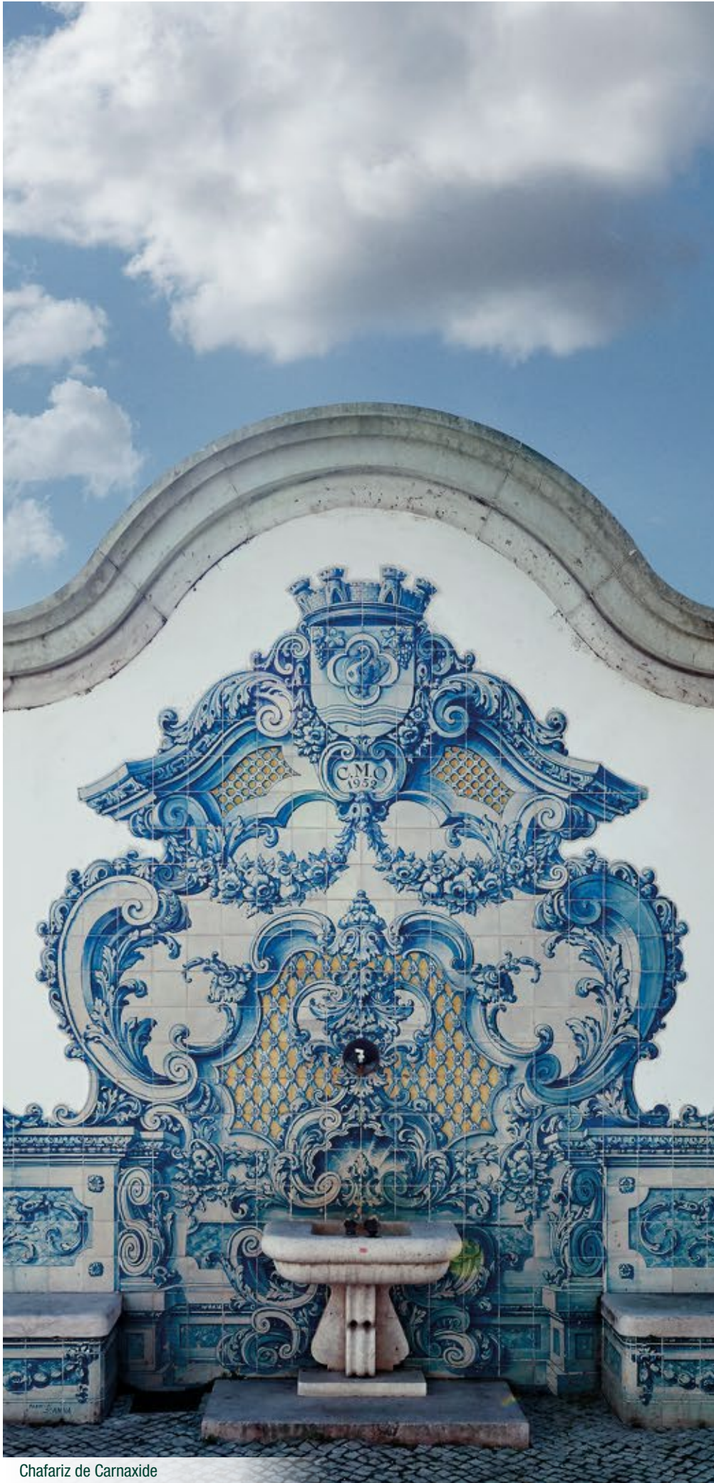
Chafariz de Carnaxide