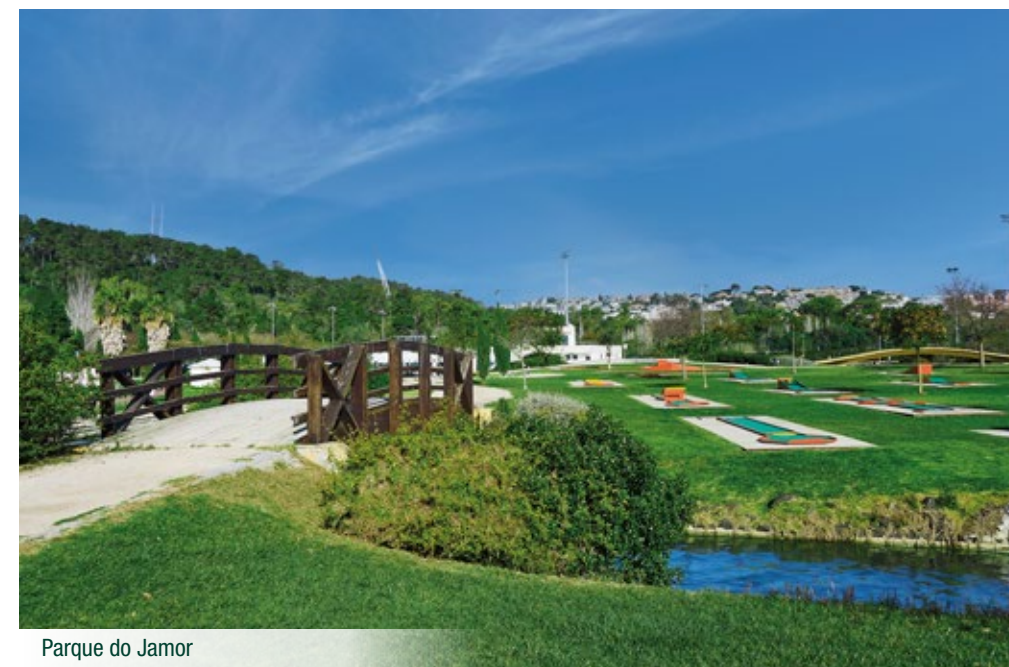
Parque do Jamor