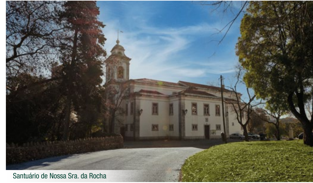
Santuário de Nossa Sra. da Rocha