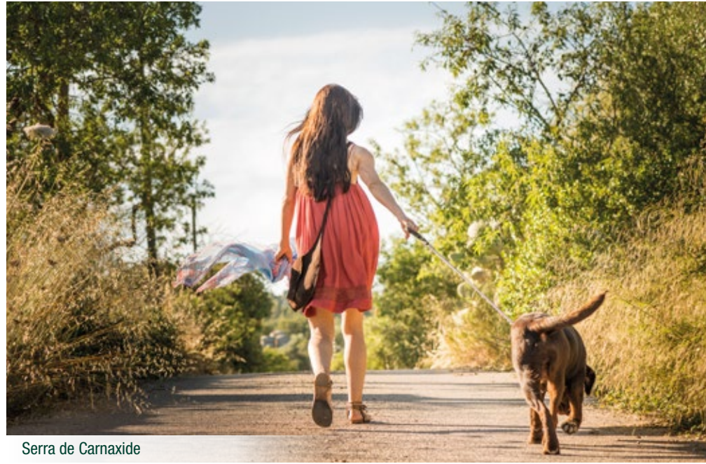
Serra de Carnaxide