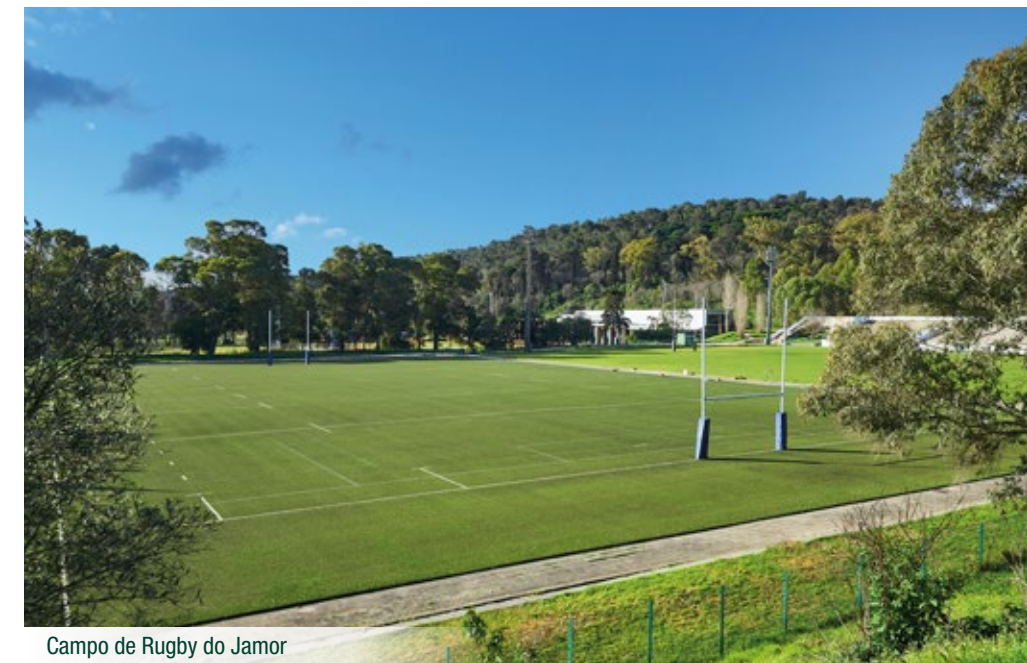
Campo de Rugby do Jamor